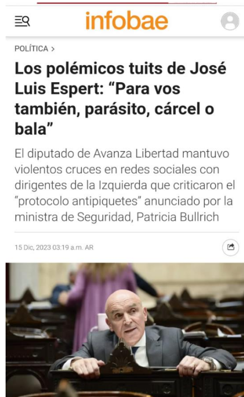
José Luis Espert